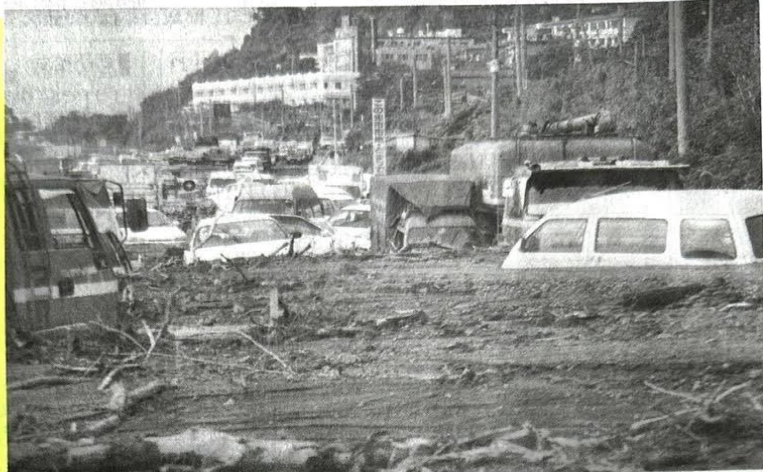
土砂にのみ込まれたトラックやワンボックスカー =1993年8月7日、鹿児島市吉野町三船付近の国道10号