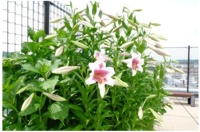
大ユリ 開花始まる