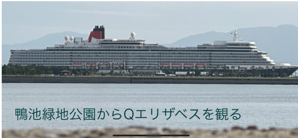
鴨池緑地公園からQエリザベスを観る

明日、5月1日はクイーンエリザベス号の倍の大きさの171,598トンのMSCベリッシマ号が寄港するそうです。